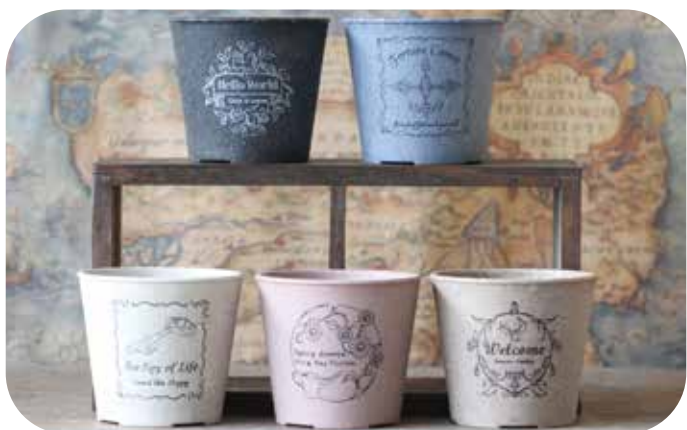
ポット(M) 上部径 65mm x 高さ 57mm