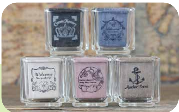
ガラスキューブ(S) 幅・奥行き 45mm x 高さ 50mm