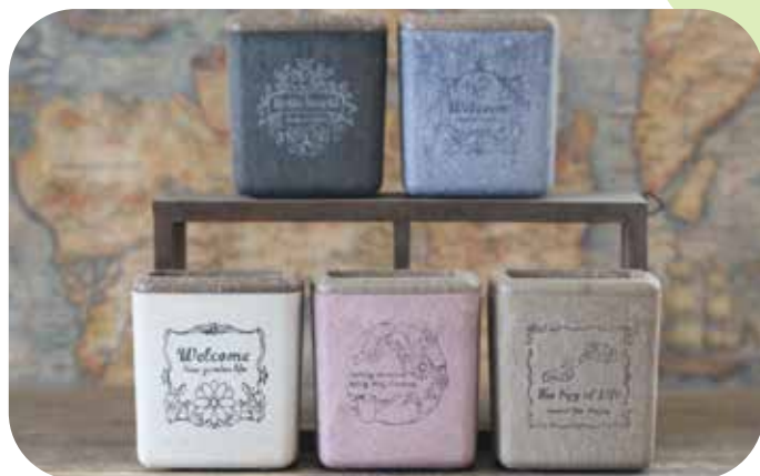
キューブ(M) 幅・奥行き 65mm x 高さ 70mm