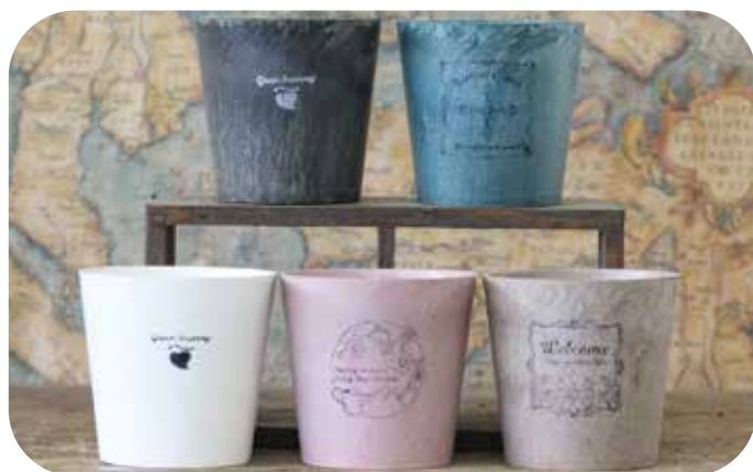
ポット(L) 上部径 75mm x 高さ 75mm