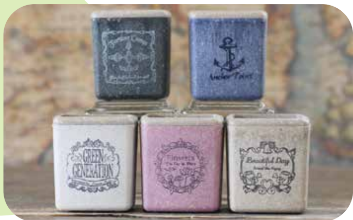
キューブ(S) 幅・奥行き 45mm x 高さ 50mm