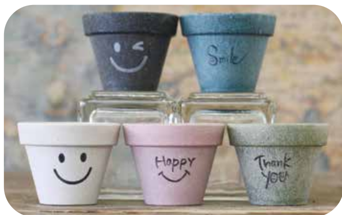
ダンポット 上部径 51mm(内部径 43mm) x 高さ 40mm